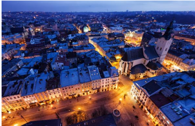
文化之都——利沃夫的夜景