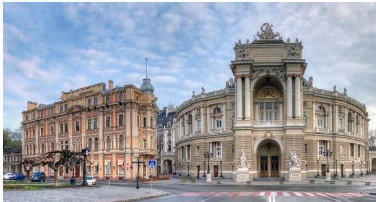
乌克兰著名城市敖德萨