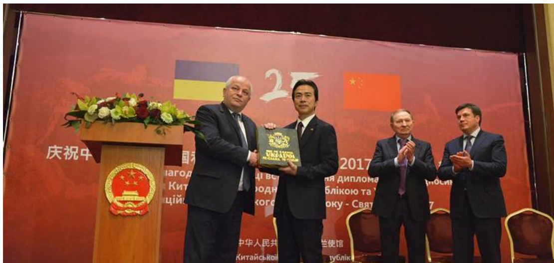
中乌建交 25 周年暨 2017 华侨华人新春招待会在乌克兰首都基辅举行 图为中国驻乌克兰大使杜伟（右）以及乌克兰第一副总理库比夫（左）

乌克兰总统波罗申科表示，乌中关系十分重要。今年是乌中建交 25 周年。乌方将同中方共同努力，扩大两国政治、经贸合作。双方在物流、港口、农业、钢铁、机械制造等领域合作潜力巨大，乌方欢迎中国企业加大对乌投资。